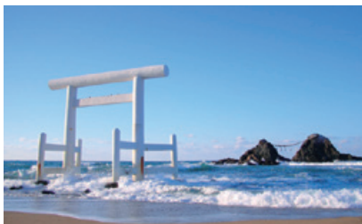
桜井二見ヶ浦