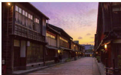
ひがし茶屋街