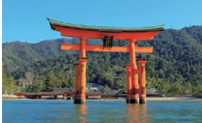
厳島神社